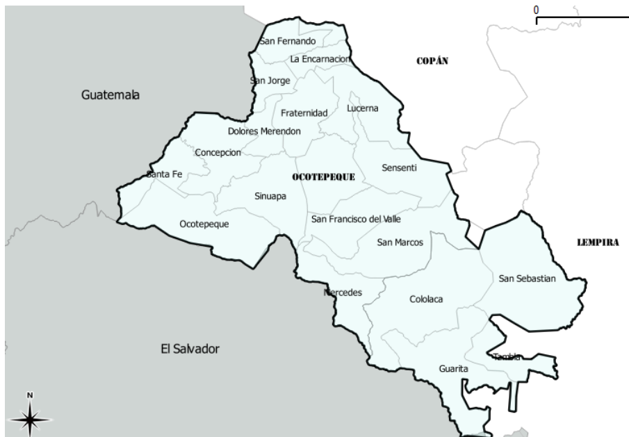
Imagen 3. Municipios dentro del Corredor Biológico Trifinio Fraternidad